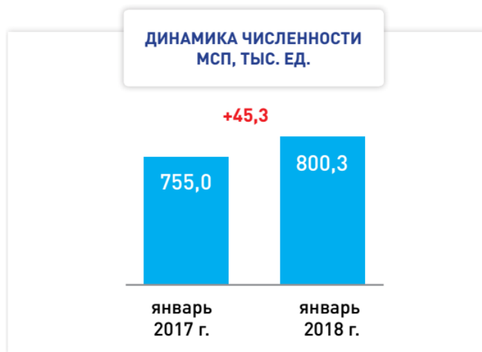
Рис.1 Динамика развития МСП в г.Москва

внедрением патентной системы налогообложения. По данным Федеральной налоговой службы, на 1 августа 2017 года в Москве было зарегистрировано 274 тысячи индивидуальных предпринимателей. А это значит, что в столице работает каждый седьмой российский ИП. В Москве в первом полугодии 2017 года было приобретено 57 тысяч патентов на сумму 4,6 миллиарда рублей. Наиболее активно патенты используются в сфере розничной торговли и бытовых услуг, а также при сдаче в аренду нежилых помещений[4].