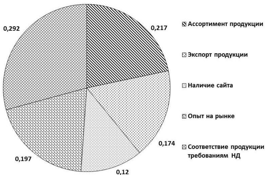
Рисунок 1 – Значимость критериев оценки деятельности предприятия.

Для оценки деятельности сравниваемых предприятий предварительно необходимо оценить значимость каждого критерия. Диаграмма значимости показателей, полученная экспертным методом, представлена на рис.1.