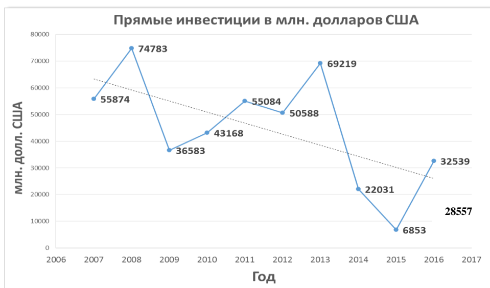
Рисунок 3. Объем ПИИ в Российской Федерации в 2007-2017 гг. Источник: Составлено автором на основе данных официального сайта Центрального Банка Российской Федерации, [Электронный ресурс] // Режим доступа: www.cbr.ru/statistics [дата обращения: 02.01.2019].

Негативную роль для российской экономики сыграли санкции принятые со стороны Европы и негативные прогнозы по экономическому росту. В 2015 году также последовало дальнейшее снижение до уровня 6478 млн. долл. США. Однако, по итогам 2016 года прямые иностранные инвестиции в Россию увеличились на 62%, составив $32,539 млн. долларов США, по сравнению с 2015 годом [4].