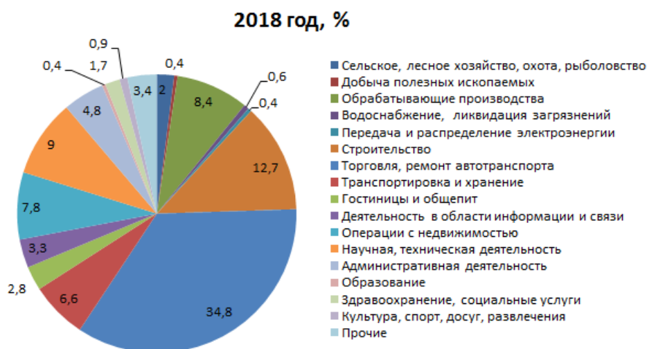
Рисунок 3 – Структура малых предприятий в России по отраслям экономики в 2018 г.

Наибольшее количество субъектов малого бизнеса в течение трех рассматриваемых лет осуществляют деятельность в сфере торговли и ремонта автотранспорта: в 2016 году количество таких предприятий составляет 37,3 % от общего количества субъектов малого бизнеса, в 2017 и 2018 году данный показатель несколько снижается и оценивается в 36,2 и 34,8 % соответственно. Также, популярным направлением деятельности среди субъектов малого предпринимательства является строительство, доля таких предприятий на протяжении трех лет составляет чуть более 12 % от общего количества действующих малых предприятий [5].