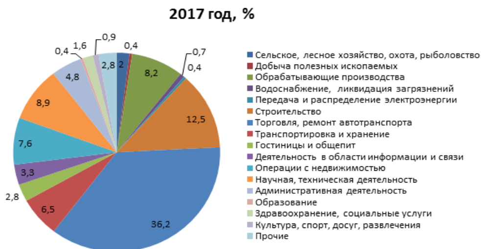
Рисунок 2 – Структура малых предприятий в России по отраслям экономики в 2017 г.