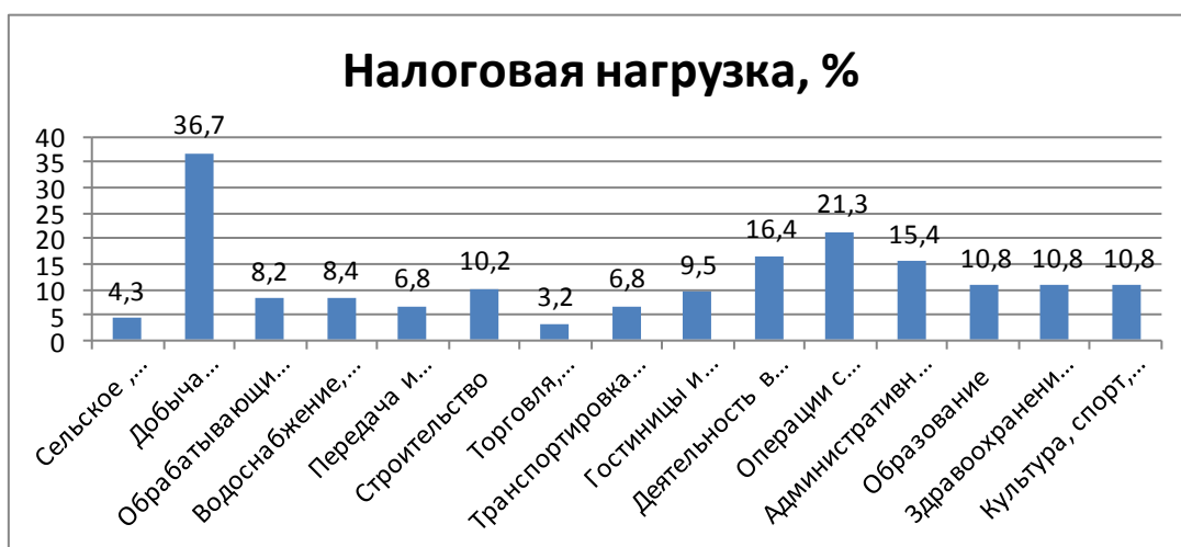
Рисунок 5 - Средний уровень налоговой нагрузки субъектов малого бизнеса по видам экономической деятельности (с учетом НДС).

Наибольшее количество начисленных налогов (рис.5) уплачивают субъекты малого бизнеса, занимающиеся добычей полезных ископаемых, их средняя налоговая нагрузка оценивается в 36,7 %, также значительная доля налогов приходится на малые предприятия, работающие в сфере операций с недвижимостью (21,3 %). Наименьшая налоговая нагрузка приходится на предприятия, работающие в сфере торговли и ремонта автотранспорта (3,2 %), сельского, лесного хозяйства (4,3 %) [4].