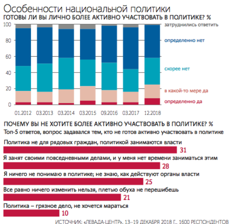
Рис. 1. Опрос от Левада-центра в конце 2018 год [12]