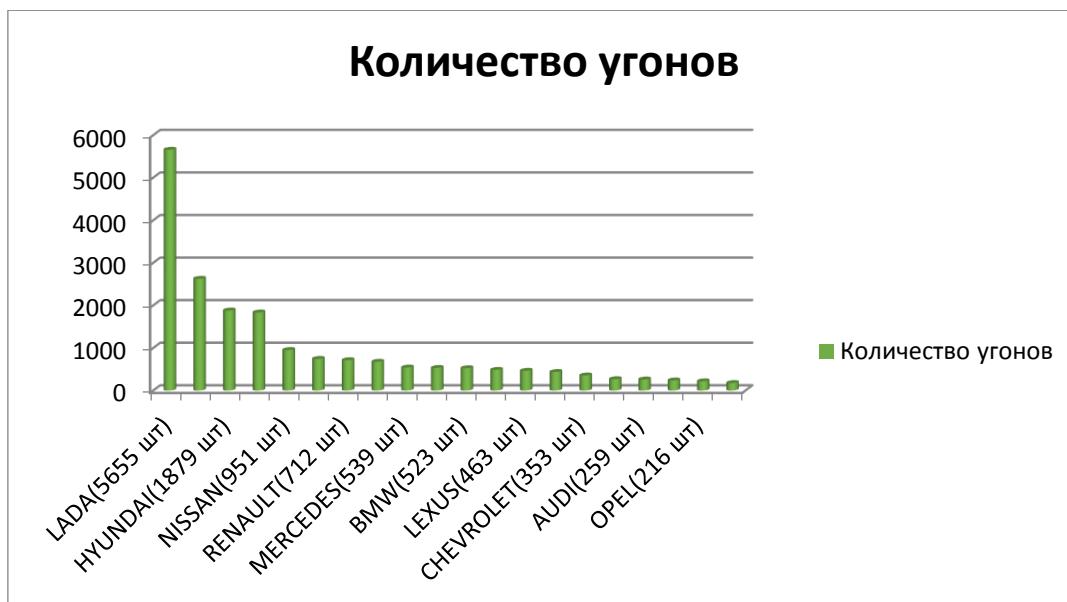
Рис.2 Количество угонов [3]

Судебная практика по краже. В судебной практике немало примеров хорошо подготовленных краж автомобилей, приведём один из них.