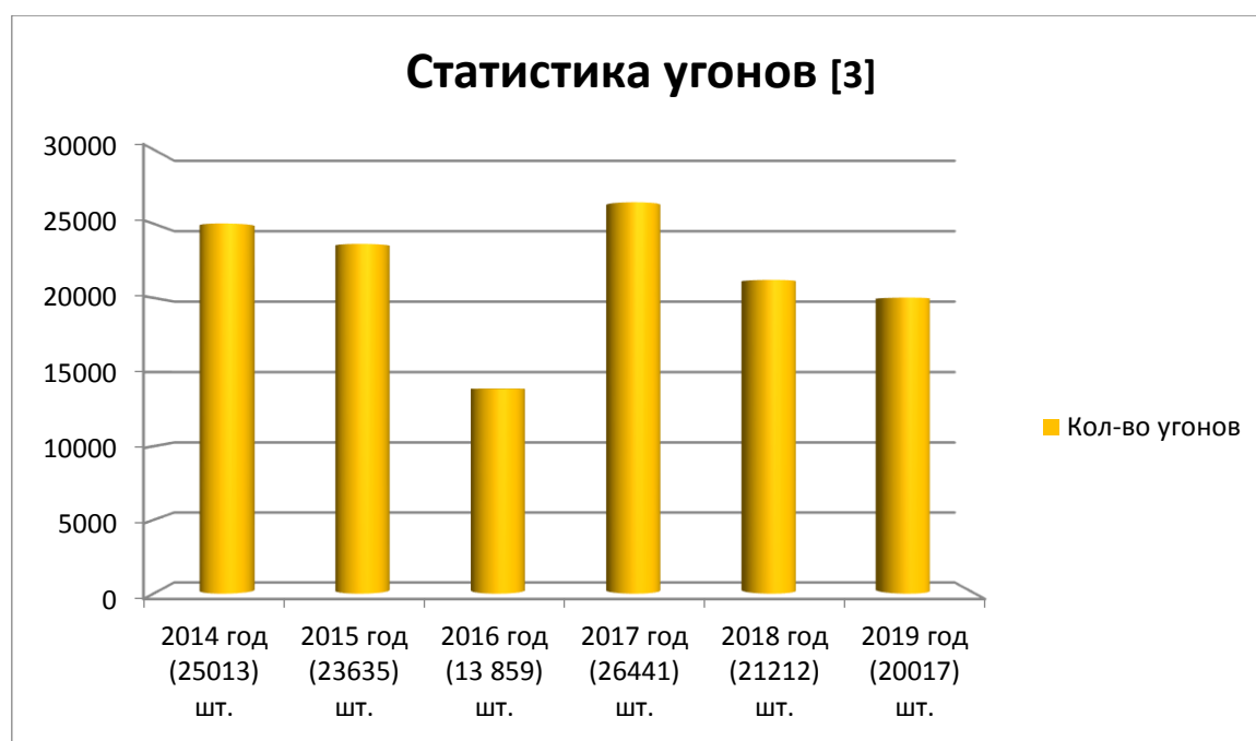
Рис. 1 Статистика угонов. [3]

Введение. Преступления против собственности являются актуальными у злоумышленников. Согласно судебной статистике за первое полугодие 2019 года число осуждённых составило: 111 274 человека [2]. Проанализировав данные, становится видно, что кража, неправомерное завладение автомобилем продолжают представлять собой распространённые преступления против собственности. Так, по данным ГИБДД РФ за 2019 год, количество угонов составило 20017 [3]. Уголовный кодекс РФ регламентирует наказание за угон автомобиля в статье 166 УК РФ, за кражу в 158 УК РФ. Однако, в уголовной практике зачастую возникают проблемы, связанные с отграничением кражи автомобилей от угонов, появляются трудности в квалификации содеянного.