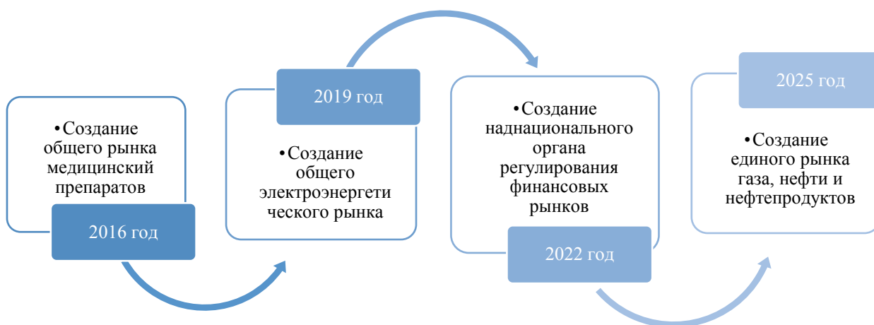
Рисунок 2. Стратегические перспективы формирования единого рынка ЕАЭС

Более того, крутым поворотом в стратегическом развитии интеграционного сообщества является процесс создания общих рынков, включая рынки энергоресурсов. Данные по общим рынкам ЕАЭС представлены на рисунке 2 [2].