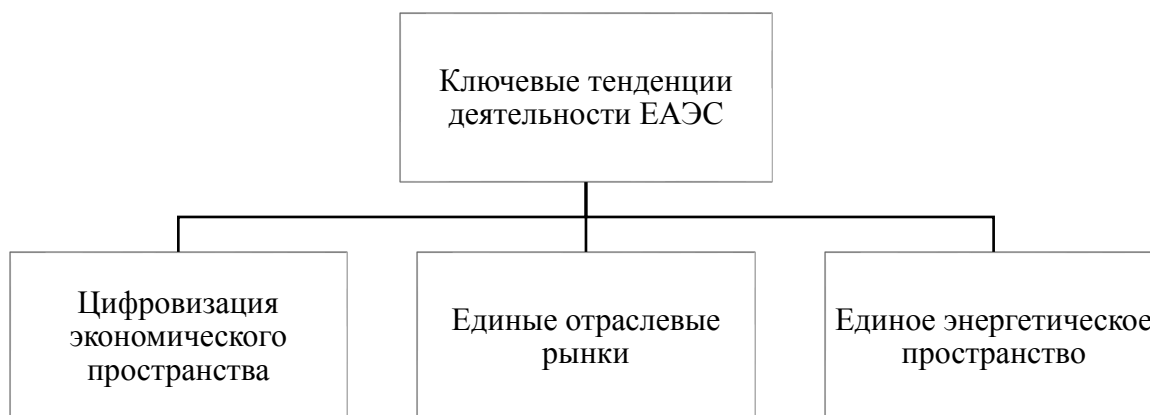
Рисунок 1. Ключевые тенденции деятельности ЕАЭС

Развитие современных экономик характеризуется наращиванием объемов цифровизации и глобализации всех внутренних структур государств-членов ЕАЭС. Так, основные тренды развития евразийской интеграции на современном этапе представлены на рисунке 1 [4].