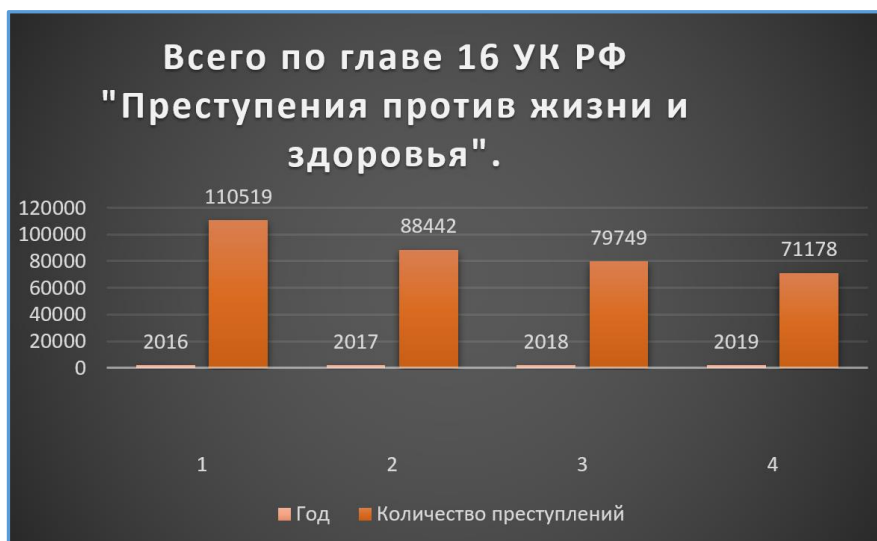
Рис. 1. Статистика преступлений по 16 главе УК РФ [5].

уголовные дела прекращены по иным основаниям по основной статье, остаётся незначительным. Наиболее часто необходимая оборона возникает в преступлениях, предусмотренных ст. 108, 114 УК РФ. Их статистика приведена на графике [11]. Вопрос правового регулирования института необходимой обороны в российском законодательстве является актуальным, поскольку нормы уголовного и уголовно-процессуального законодательства не всегда применяются правильно, и из-за этого лицам, вынужденным применить необходимую оборону при наличии действительно общественно опасного посягательства, суды выносят приговор по ст. 108, 114 УК РФ.