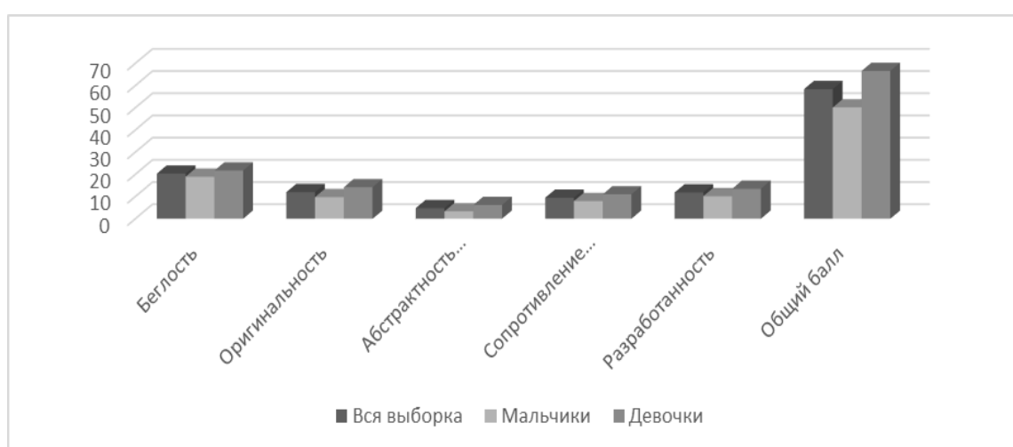
Рисунок 1. - Гендерные особенности креативности у подростков по методике Э. Торренса

При сравнении общего среднего уровня креативности (общий балл) между мальчиками и девочками было установлено, что в среднем уровень креативности у девочек выше, чем у мальчиков. Различия в уровне креативности наглядно представлены на рис. 1.