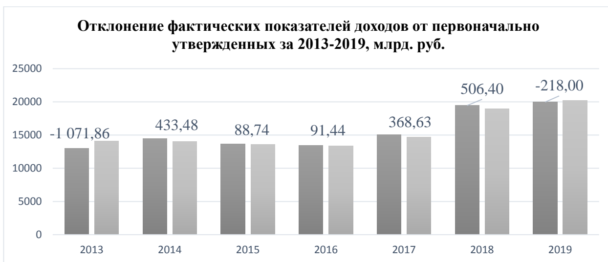
Диаграмма 3 - Отклонение фактических показателей доходов от первоначально утвержденных, млрд. руб. за 2013-2019 гг. [5]

фактических показателей доходов от первоначально утвержденных, млрд. руб. за 2013-2019 гг.