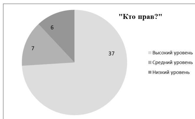
Рисунок 5 – Результаты диагностики умения обосновывать и высказывать собственное мнение