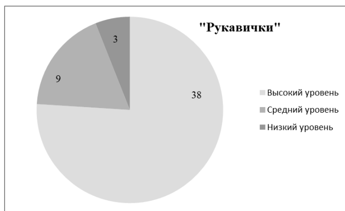
Рисунок 4 – Результаты диагностики умения группового взаимодействия

По итогам проведения занятий по разработанной программе мы провели вторичную диагностику сформированности коммуникативных умений младших школьников (результаты диагностики представлены на рис. 4, 5, 6).