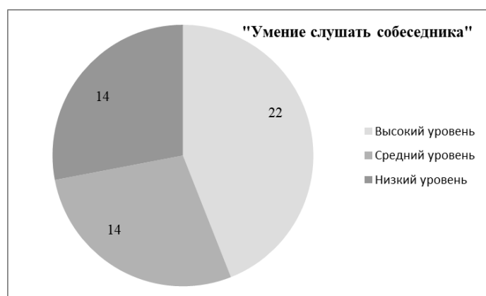
Рисунок 3 – Результаты диагностики умения слушать собеседника

Приведенные результаты свидетельствуют о необходимости подбора форм деятельности, актуальных для повышения уровня коммуникативных умений младших школьников. В программу формирующего этапа нами