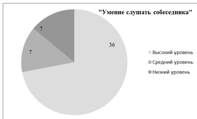
Рисунок 6 – Результаты диагностики умения слушать собеседника

В результате вторичной диагностики детей по итогам эксперимента удалось установить, что уровень их коммуникативных умений повысился на 50%, что свидетельствует об эффективности разработанной нами программы и целесообразности ее последующего применения и совершенствования. Применение подобранных методик способствовало формированию коммуникативных компонентов: умение группового взаимодействия, умение выражать свои мысли в соответствии с коммуникативной ситуацией, умение эффективно взаимодействовать друг с другом, умение задавать вопросы и отвечать на них, умение делать выводы из полученной информации, повысилась их культура сотрудничества и коммуникации. В дальнейшем считаем важным разработать программу формирования коммуникативных умений младших школьников в рамках проектной деятельности, подразумевающей элементы научно-практических исследований детей совместно с родителями и педагогами.