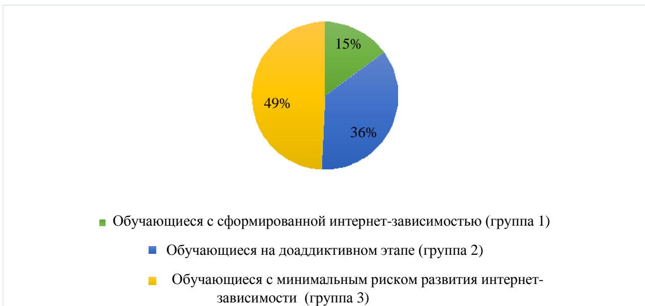
Рисунок.2. Распределение обучающихся по группам

Далее были проанализированы данные, полученные с помощью авторской анкеты, вопросы которой были направлены на изучение особенностей использования социальных сетей обучающимися. Значимые различия между группами определялись с помощью применения Н-критерия Краскела-Уоллиса. Результаты анкеты также позволили подтвердить адекватность распределения выборки согласно результатам теста на интернет-зависимость.