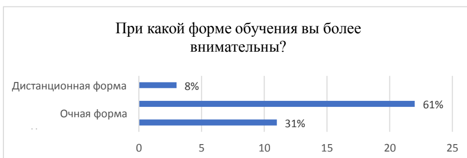
Диаграмма 1. Форма обучения, при которой студенты более внимательны

На вопрос «Что помогает удерживать внимание при очной форме обучения» 25 студентов (69%) ответили «интерес к предмету, 24 человека (67%) – личность преподавателя, 16 студентов (44%) выбрали ответ «желание получить необходимые знания», 12 учащихся (33%) – наглядные материалы и