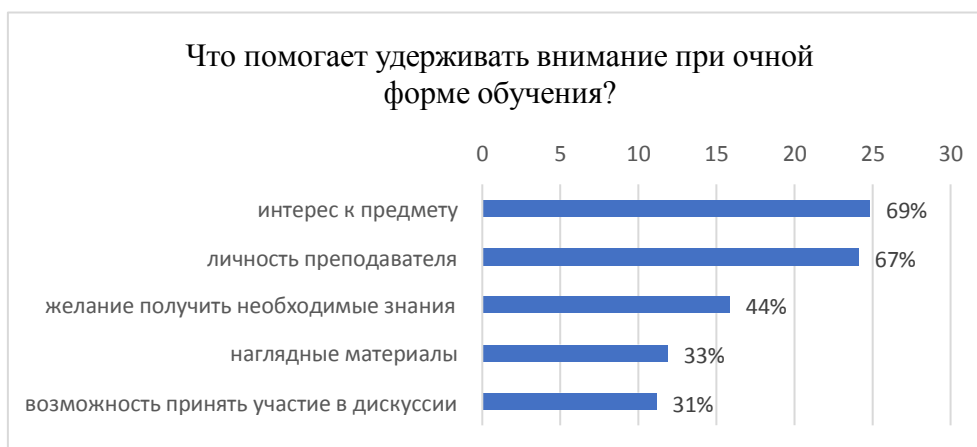
Диаграмма 2. Факторы, удерживающие внимание студентов при очной форме обучения

На вопрос «Что мешает при очной форме обучения удерживать внимание?» 27 студентов (75%) выбрали ответ «скучная подача лекционного материала», 15 студентов (42%) – отсутствие интереса к предмету, 12 студентов (33%) – разговоры со студентами, 12 студентов (33%) – отсутствие применимости, 12 студентов (33%) – однородная подача материала. Результаты опроса позволяют констатировать, что преподаватели не используют на своих занятиях нетрадиционных методов и приемов обучения. Данный вопрос требует особого внимания.