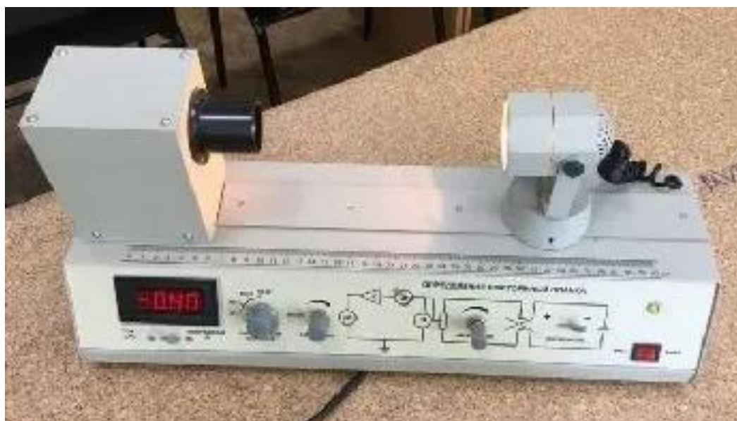
Рисунок 1 – Внешний вид установки для исследования явления внешнего фотоэффекта [1]

2. Построение графика зависимости напряжённости электростатического поля от величины «пробега» вырванных с поверхности катода фотоэлектронов, отдельно для трёх заранее выбранных величин длин волн монохроматического излучения, соответствующих красному, зелёному и синему цветам.