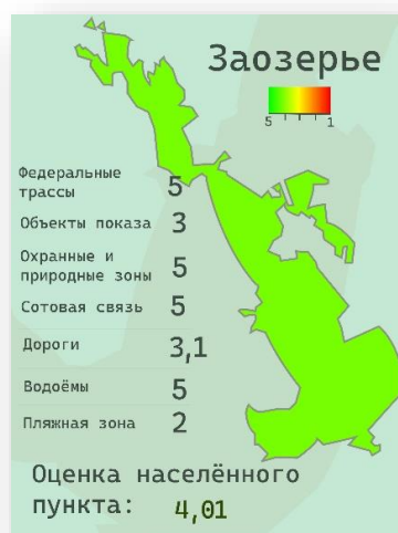
Рисунок 1. Карта туристического потенциала Заозерья

- Электроснабжение (Оценивалось наличие ЛЭП, трансформаторных подстанций, распределительных устройств и т.п.).