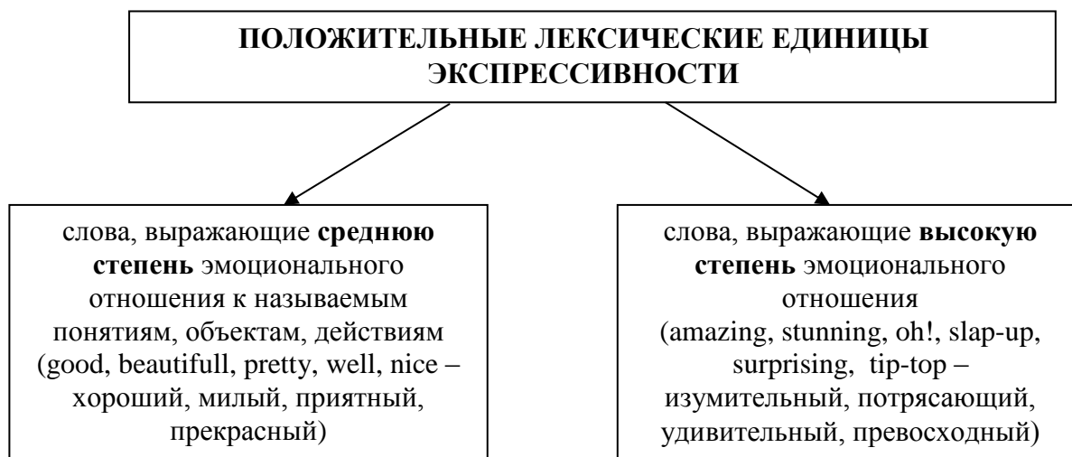
Рисунок 1 – Положительные лексические единицы экспрессивности

Для наилучшего понимания сущности экспрессивности в словообразовании рассмотрим классификацию Ю. Н. Антюфеевой. Упомянутый автор выделяет стилистически маркированные лексические единицы в группу эмоционально-экспрессивных. Обратим внимание на следующие авторские единицы (рисунок 2) [1, с. 86]: