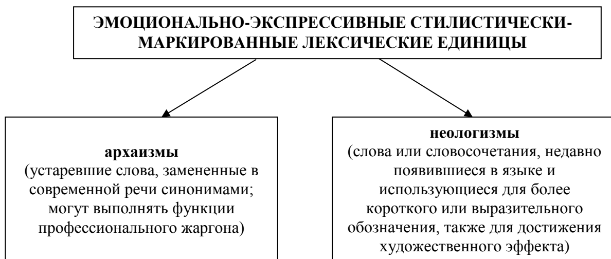
Рисунок 2 – Эмоционально-экспрессивные стилистически-маркированные лексические единицы

Для наилучшего понимания сущности экспрессивности в словообразовании рассмотрим классификацию Ю. Н. Антюфеевой. Упомянутый автор выделяет стилистически маркированные лексические единицы в группу эмоционально-экспрессивных. Обратим внимание на следующие авторские единицы (рисунок 2) [1, с. 86]: