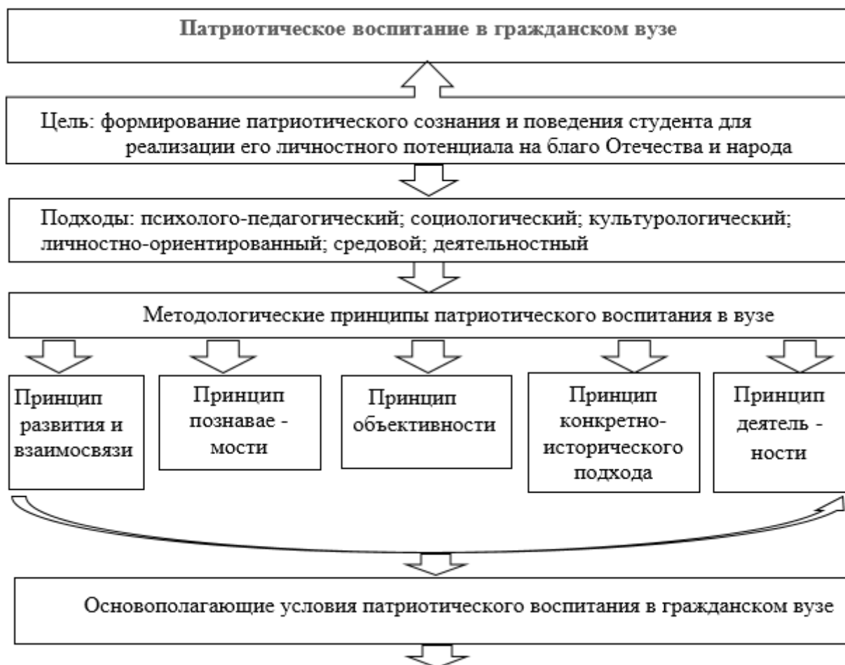
Схема 1. Модель патриотического воспитания в гражданском вузе

Для выполнения условий нужны люди, которые будут их реализовывать.