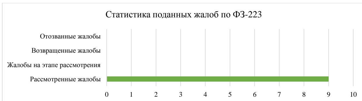
Рисунок 2. Статистика поданных жалоб по 223-ФЗ

Аналогично была составлена статистика поданных жалоб по ФЗ-223 за первое полугодие 2022 года (рисунок 2).