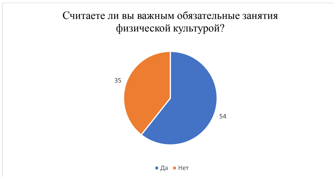
Диаграмма 5. Мнение школьников об обязательных занятиях физической культурой

35 школьников не считают важными обязательные занятия по физической культуре. Из этого можно сделать вывод, что многие больше заинтересованы в дополнительных секциях.