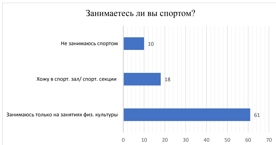
Диаграмма 2. Количество занятий спортом

Большинство старшеклассников занимаются спортом только на уроках, организованных учебным заведением. Только 18 человек занимаются им вне школы. Еще 10 опрошенных вообще не занимаются им по каким-либо личным причинам.