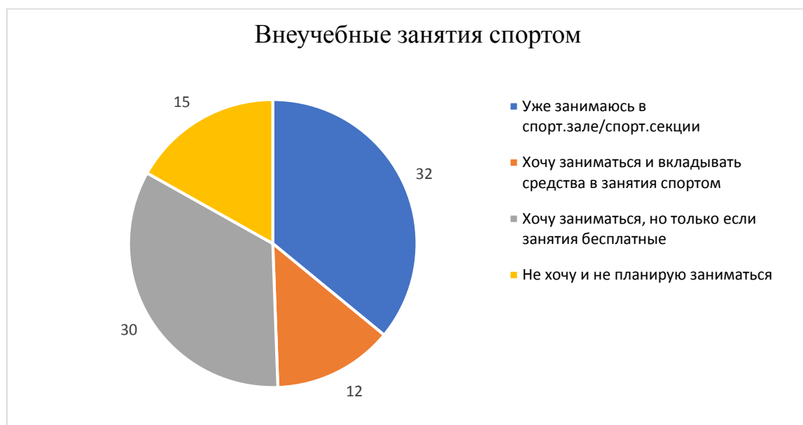
Диаграмма 3. Внеучебные занятия спортом

15 школьников не хотят и не планируют заниматься спортом дополнительно. 44 человека уже занимаются или хотят им заняться. К сожалению, многие не предпочитают тратить деньги на занятия спортом, поэтому для них очень важно наличие бесплатных секций.