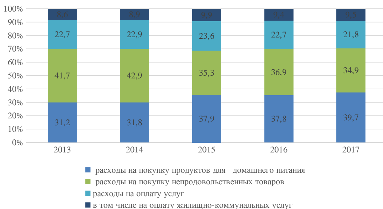
Рисунок 2 – Структура использования денежных доходов населения, %

Структура использования денежных доходов представлена на рисунке 2. Так, наблюдается увеличение расходов на покупку продуктов для домашнего питания, которые имеют наибольший удельный вес по итогам 2017 г. На втором месте находятся расходы на покупку непродовольственных товаров – 34,9 %. Оплата услуг занимает 21,8 % в общей структуре расходов населения, из них почти половина – 9,5 % направляется на оплату жилищно-коммунальных услуг.